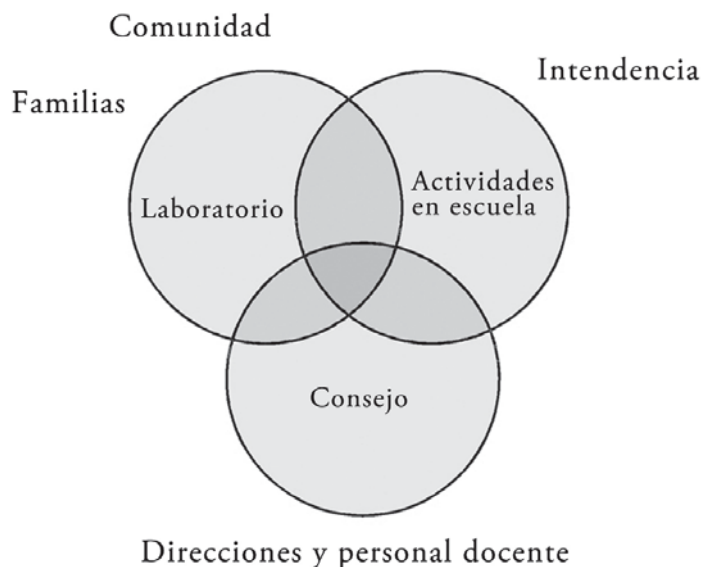
FIGURA 3 | Pilares de la propuesta en Montevideo