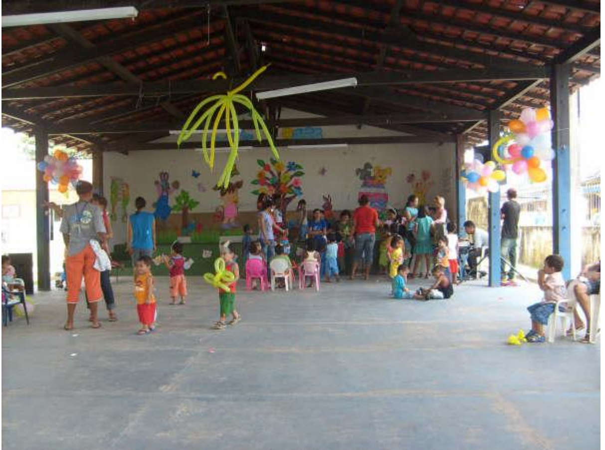
Figura 1: Foto representativa do Barracão